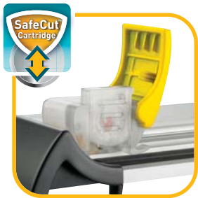
Einzigartige SafeCut™ Schneidekassetten