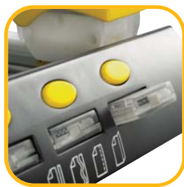
Integrierte Aufbewahrung für SafeCut™ Schneidekassetten