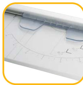
Formatraster für DIN-Formate, Fotos und Winkelanlage