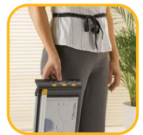
Tragegriffe für leichten Transport