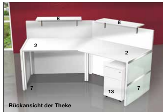
Rückansicht der Theke