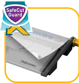
Vorinstallierte SafeCut™ Schutzvorrichtung verhindert Installationsfehler