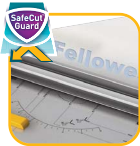
SafeCut™ Schutzvorrichtung verhindert falsche Bedienung