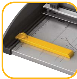
Verstellbarer Rückanschlag für präzises Schneiden