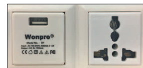
Interner USB-Anschluss und Steckdose *nur werksseitig auf Anfrage lieferbar