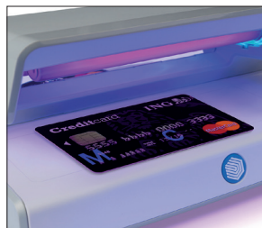
Prüft Kreditkarten, Pässe und andere Ausweise auf Echtheit