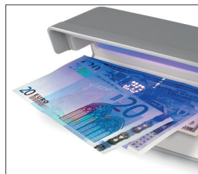
Eignet sich für alle Währungen