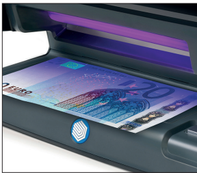
Kontrolliert die UV-Merkmale von Geldscheinen