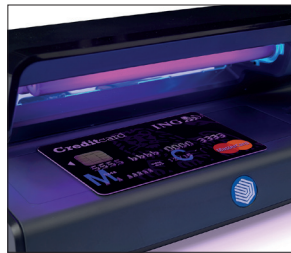
Prüft Kreditkarten, Pässe und andere Ausweise auf Echtheit