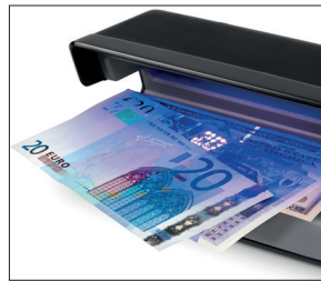
Eignet sich für alle Währungen