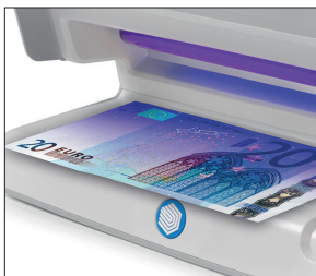
Kontrolliert die UV-Merkmale von Geldscheinen