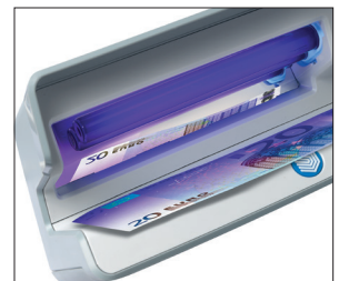
Mit Reflektor für extra-starke UV-Licht Qualität