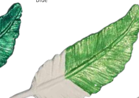
Apfelgrün Apple Green