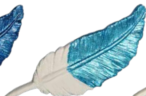
Eisblau Ice Blue