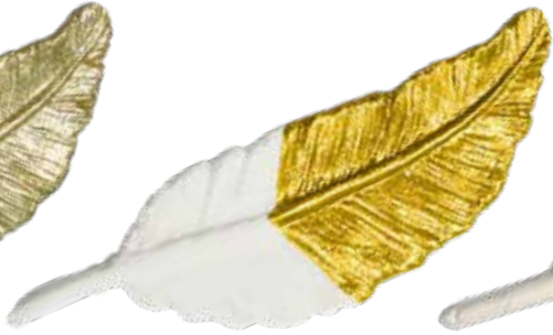
Altgold Old Gold